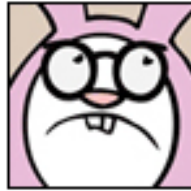
A Christmas Story