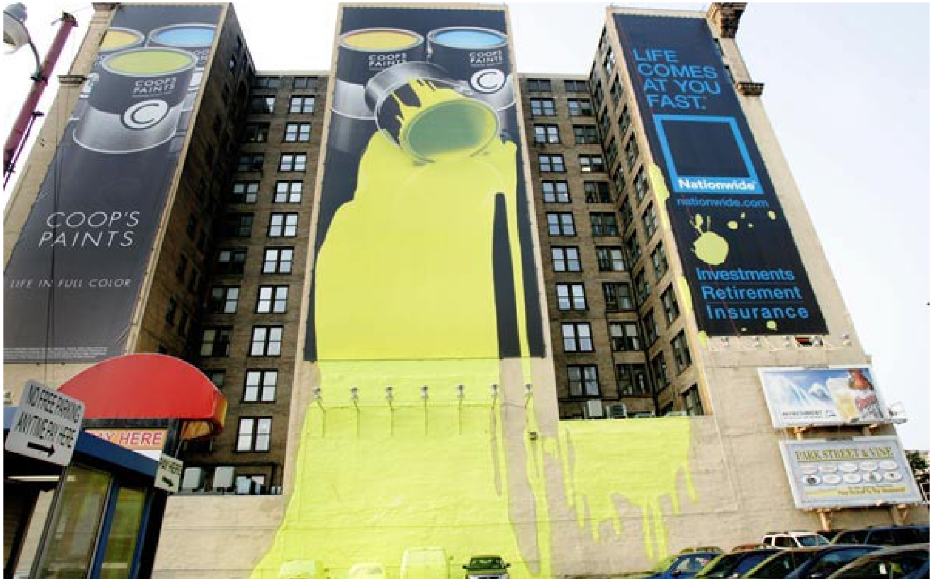
Ein Fall für den „Ugly Graffiti“-Aufkleber (Seite 7)