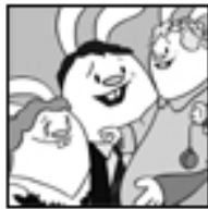
It's a Wonderful Life