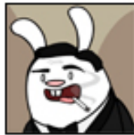
James Bond medley