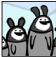
March of the Penguins