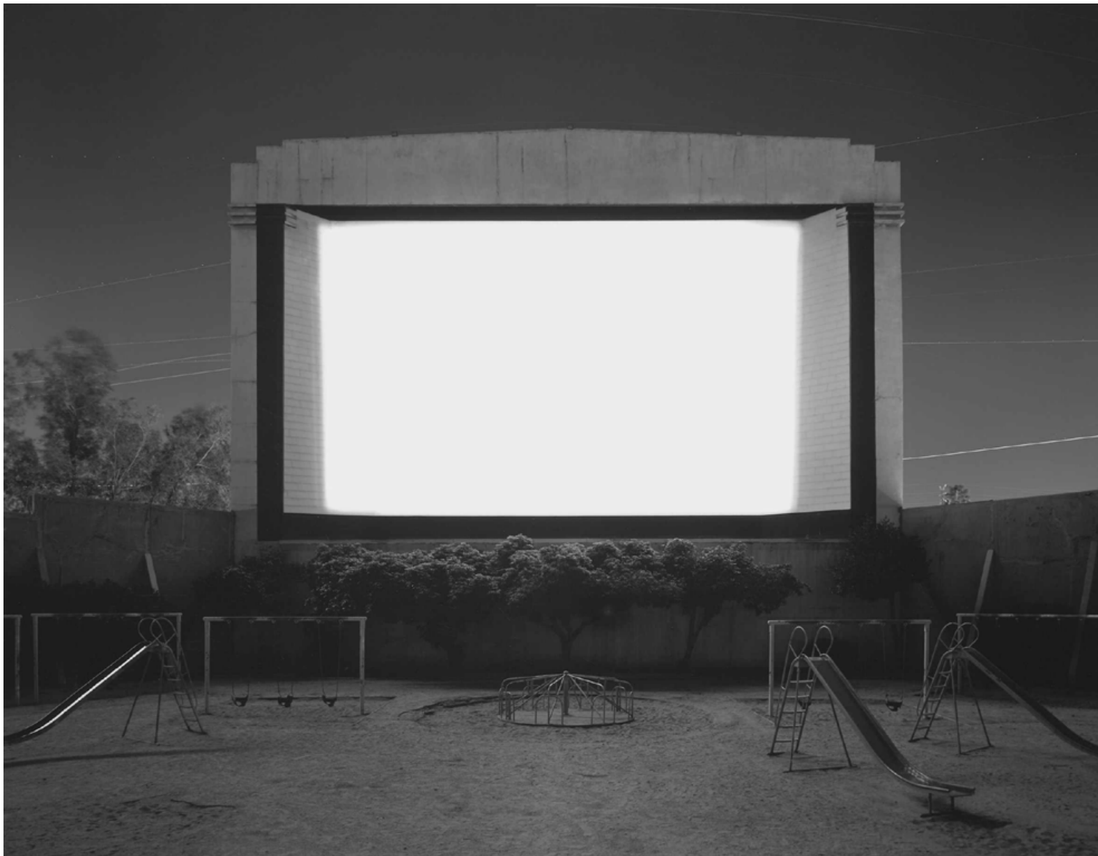
Tri-City Drive-In, San Bernardino, 1993 Silbergelatineabzug/ Gelatin silver print 119,4 x 149,2 cm