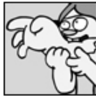
Night of the Living Dead