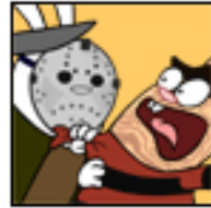
Freddy vs. Jason